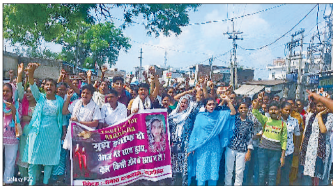
भिवानी। विरोध प्रदर्शन करती छात्राएं।