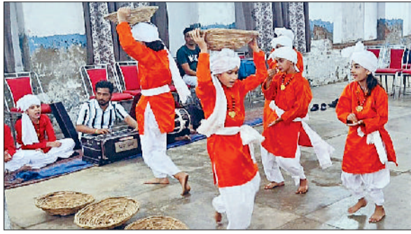
भिवानी। कार्यक्रम में अपनी प्रस्तुति देती प्रतिभागी।