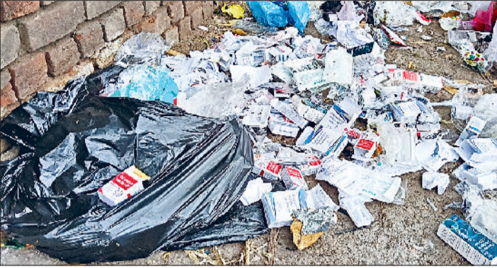
भिवाणी। पंचायत भवन के पास डाला गया हॉस्पिटल का बायोवेस्ट व रेस्टोरेंट का कचरा।

पंचायत भवन के पास कमला भवन के सामने अवैध कचरा प्वाइंट बना हुआ है, जहां पर प्रतिदिन हॉस्पिटल एवं रेस्टोरेंट संचालकों द्वारा बायोवेस्ट एवं कचरा डाला जा रहा है। अवैध कचरा प्वाइंट पर डाले गए बायोवेस्ट व कचरे में बेसहारा पशु दिनभर मुंह मारते रहते हैं। बायोवेस्ट में नीडल्स, सीरिज, दवाई के खाली रैपर, ग्लाऊस सहित अन्य सामान शामिल है, जो बेसहारा पशुओं के लिए जानलेवा साबित हो रहा है। वहीं रेस्टोरेंट का बचा हुआ खाना व कचरा आदि भी काफी मात्रा में डाला जाता है, जिनपर न नगर परिषद और न जिला प्रशासन कोई कार्रवाई कर रहा, जो शहर के सौंदर्यीकरण में रोड़ा बने हुए हैं। उल्लेखनीय हैं पंचायत भवन के पास अवैध