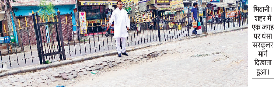
भिवाणी। शहर में एक जगह पर धंसा सरकुलर मार्ग दिखाता हुआ।

शहर के व्यस्ततम सरकुलर रोड पर दिनोंद गेट से घंटाघर की ओर जाने वाली सड़क पर पिछले कई दिनों से जमीन धंसने की समस्या ने लोगों को परेशान कर रखा है। यह समस्या धीरे-धीरे एक बड़े गड्ढे का रूप ले चुकी है, जिससे आए दिन वाहन चालक दुर्घटनाओं का शिकार हो रहे हैं। दुकानदारों और निवासियों का आरोप है कि संबंधित विभाग इस समस्या का कोई स्थाई समाधान नहीं कर रहा, बल्कि सिर्फ खानापूर्ति करके मामले को रफा-दफा कर देता है। मंगलवार को जनकल्याण