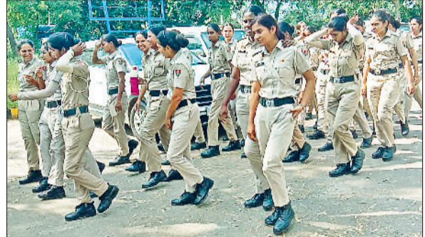
लोहारू। किसी अप्रिय घटना से बचने के लिए बाहर से बुलाई गई महिला पुलिस।